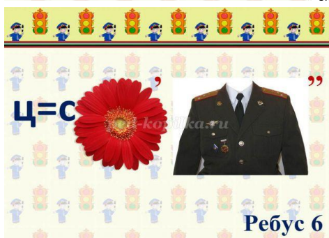
Ребус 6 светофор