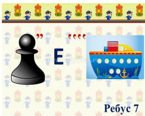
Ребус 7 пешеход