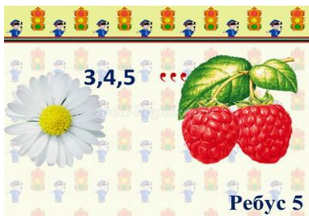
Ребус 5 машина