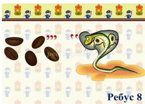
Ребус 8 зебра